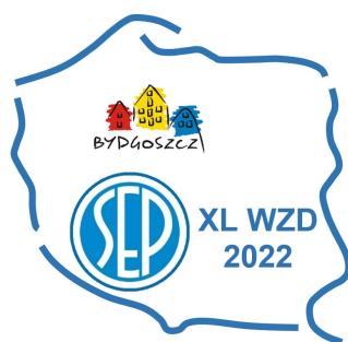
Logo XL Walnego Zjazdu Delegatów Stowarzyszenia Elektryków Polskich

Logo, jako pewien wyraz artystyczny, powinno pobudzać wyobraźnię i odczucia artystyczne każdego odbiorcy indywidualnie, dlatego ograniczę się jedynie do zwrócenia uwagi na trzy elementy. Kontur Polski symbolizuje ogólnopolski charakter działalności Stowarzyszenia Elektryków Polskich. Logo SEP jednoznacznie określa o jakie Stowarzyszenie chodzi. Logo miasta Bydgoszczy, umieszczone w geograficznym odniesieniu do konturu Polski, wskazuje na gospodarza XL Walnego Zjazdu Delegatów SEP.