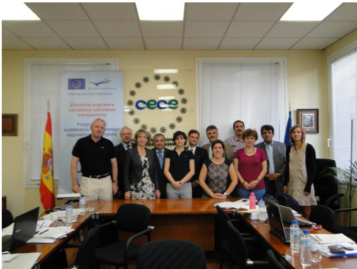
Uczestnicy spotkania Komitetu Sterującego i Komitetu Monitorującego Projektu ELEVET w Madrycie, wrzesień 2012r.