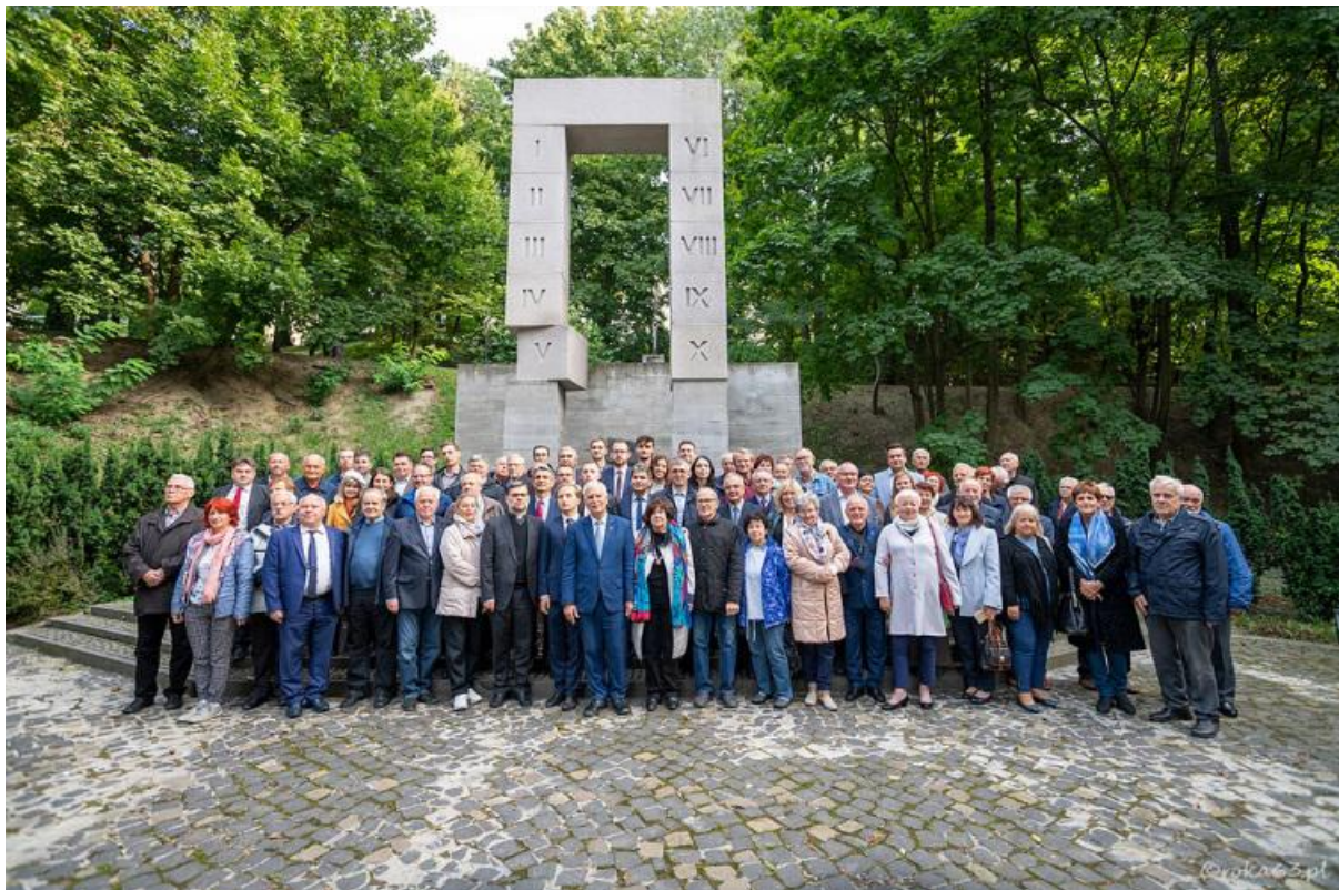
Uczestnicy uroczystości 100-lecia SEP we Lwowie, przed pomnikiem pomordowanych Profesorów Lwowskich na Wzgórzach Wuleckich.

Zostały podpisane ramowe umowy o współpracy pomiędzy SEP i Instytutem Elektrodynamiki NAN Ukrainy oraz SEP i Związkiem Naukowo-Technicznym Energetyków i Elektrotechników Ukrainy.